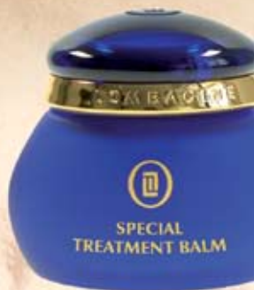
SPECIAL TREATMENT BALM 50 ml, unentbehrlich – zu Hause und auf Reisen