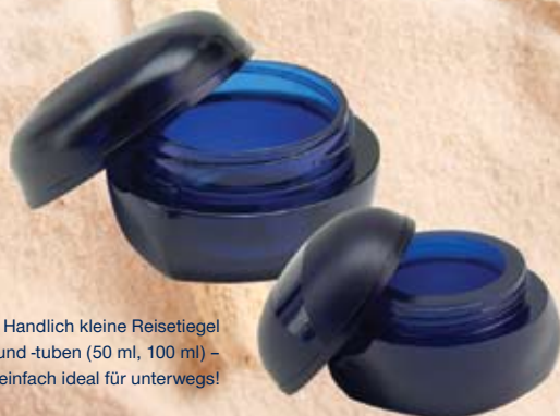
Handlich kleine Reisetiegel (5 ml, 15 ml) und -tuben (50 ml, 100 ml) – einfach ideal für unterwegs!